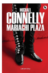
Mariachi Plaza Michael Connelly