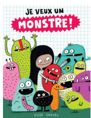
Je veux un monstre! Élise Gravel