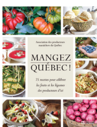
Mangez Québec! APMQ