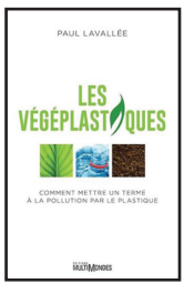
Les végéplastiques Paul Lavallée