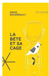
La bête et sa cage David Goudreault