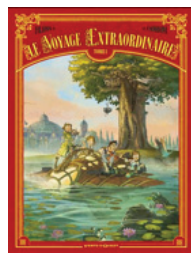
Le voyage extraordinaire Filipi/Camboni

Une autre activité du KLAD (réservée aux 11-17 ans)